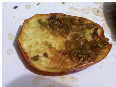
Figura 3. Excrementos y roeduras de lirón careto en una manzana.

contrar cúmulos en las horquillas de las ramas o en pequeñas superficies eleva-