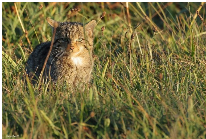
Figura 1. Gato-bravo, Felis silvestris .

Por ocasião do XVII Congresso da SECEM, presentemente a Sociedade Ibérica para a Conservação e Estudo dos Mamíferos, realizado pela primeira vez em Portugal, Évora, de 5 a 8 de dezembro de 2025, especialistas, entre os que se incluem investigadores, técnicos e outros profissionais de diferentes entidades espanholas e portuguesas, acordaram um posicionamento conjunto de grande preocupação com a situação de gato-bravo ( Felis silvestris ) na Península Ibérica e sobre as graves consequências que implicaria o seu desaparecimento do património natural ibérico.