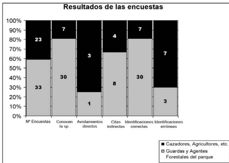
Figura 1. Resultados de las encuestas por colectivos.